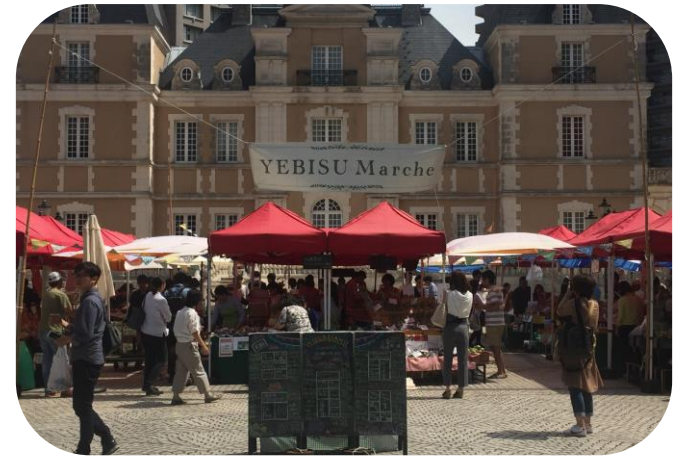
三次 販売・サービス